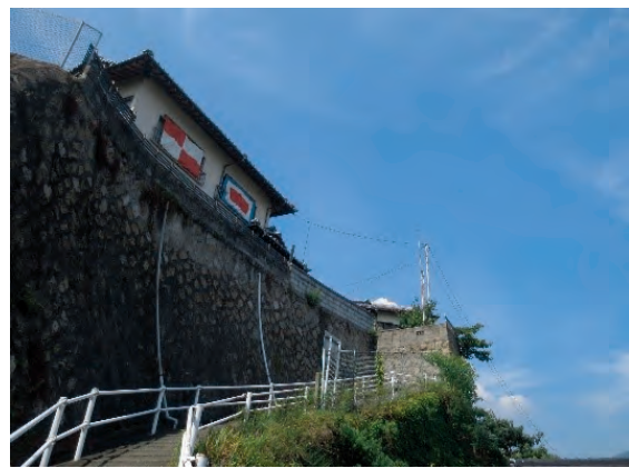
なぜ坂を上るのか？そこに石段の家があるから

今回のプロジェクトには炊事班もいらっしゃいました。炎天下の作業を支えたのが、炊事班の皆さんの働きでした。リノベ班、石釜班、作業班のモチベーションは食事が支えていたといっても過言ではないでしょう。近所の方から岡山の桃の差し入れがあり、我々もご相伴にあずかりました。