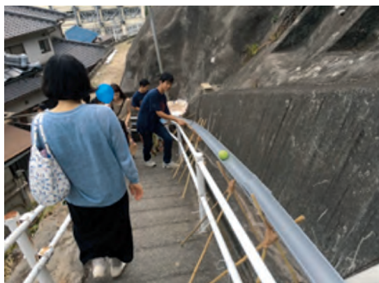
子どもに好評だったボールスライダー