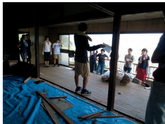
作業工程をミーティング中。みなさん真剣です