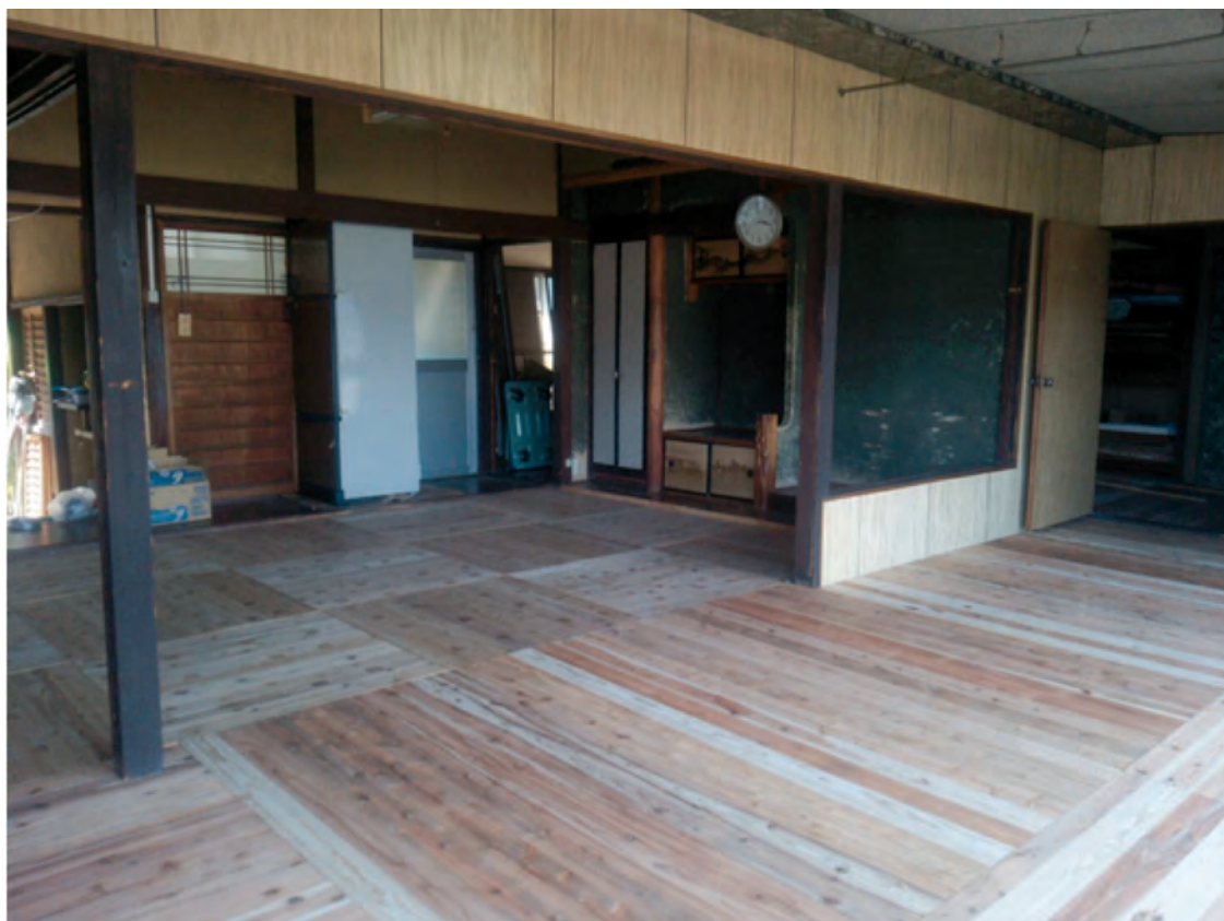
改修作業終了後の2号館

8月6日から9日にかけて、有志の学生が集まって床の改修作業を行いました。昨年度も一部改修を行いました。4月に学生が話し合った結果「若者のチャレンジを生み出す場」としてイベントスペースに改修するという方向性が定まり、今回の第2期改修作業の実施となりました。4日間の学生の頑張り、2号館はすっかり印象の違う空間になりました。