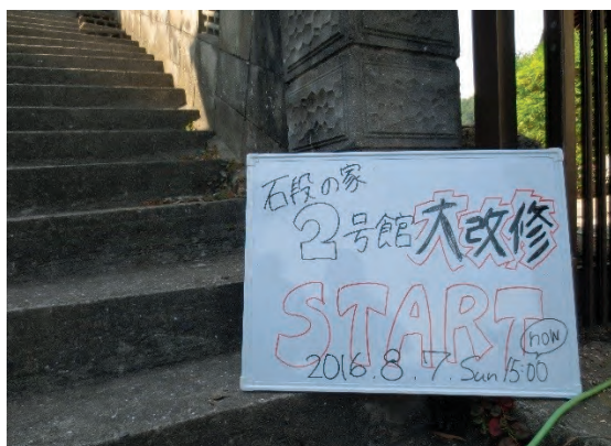
石段の家2号館 大改修がスタートしました

夏休みを利用し、8月の4日間で空き家改修が行われるということで、初日に見学に向いました。場所は呉市両城。急斜面の階段状の場所に住宅が展開しています。呉のまちを一望できる、見晴らしの良い景色に感動です。・・・が、真夏の炎天下で、辿り着くだけでふらふらです(泣)そんな中でも、学生さんたちは精悍な動きで作業をされ、皆さんが疲れ知らずのさわやかな挨拶を返してくれるのに圧倒されました。