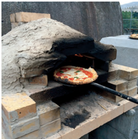
学生が製作したピザ窯でできたプロのピザ！