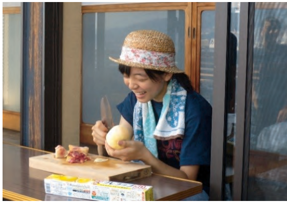
腹が減ってはリノベはできぬ