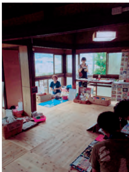
雑貨屋や古本屋が outlet

当日は心配された天候も何とかもって大盛況でした。改修された2号館を拠点として、両城、そして呉を元気づける取り組みを学生から発信してもらいたいと思います。