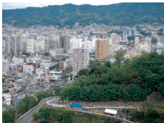
最後は七曲りでバルーンリリース