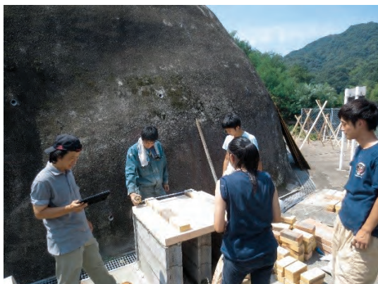
ピザ釜作りは試行錯誤で製作中

初日には、床材の張替えや、新たに設けるピザ釜作り等が行われていました。実際に施工してみると、思いもよらない事態も起こりますが、知恵を出し合いながら協力して施工されていました。一人一人が主体的に、そして楽しそうに作業されており、熱意を持って参加していることがよく分かりました。みんなで一緒に何かを作り上げた経験は、これから先の社会人生活でも、きっと大切な財産になると思います。