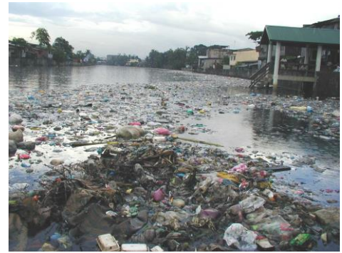
図1 発展途上国の環境汚染

内容の詳細： 環境とエネルギー、今では身近なところで良く聞く言葉になりましたが、この2つには大きな関連性があります。私達が生活して行く中では、必ずエネルギーを使いますが、今あるエネルギーを使用すると二酸化炭素等の温室効果ガスが排出され、地球温暖化等の環境問題を引き起こしています。また、エネルギーを作り出す元となっている化石燃料等の資源には限りがあり、今の生活を続けて行くといずれ無くなってしまいます。一方で、最近では環境に優しく、資源として無くない再生可能エネルギーが注目を集めています。今までは、環境問題を引き起こす原因のひとつだったエネルギーですが、再生可能エネルギーでは、環境問題を解決しながらエネルギーを利用することも出来ます。